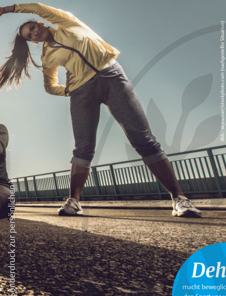
(nachgestellte Situation)